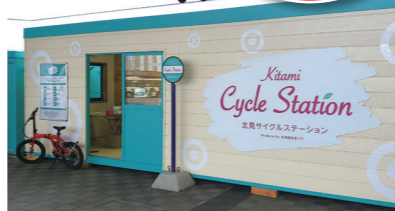
▲北見バスターミナル横にオープンした自転車やウェアがレンタルできる「北見サイクルステーション」(年内の利用は10/末まで)