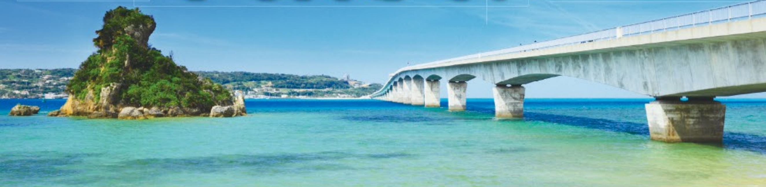
沖縄本島 古宇利大橋と海(イメージ)

日専連NICC 会員情報誌「ユカイ」です。 www.nissenren-nicc.co.jp/ 日専連ニック 検索