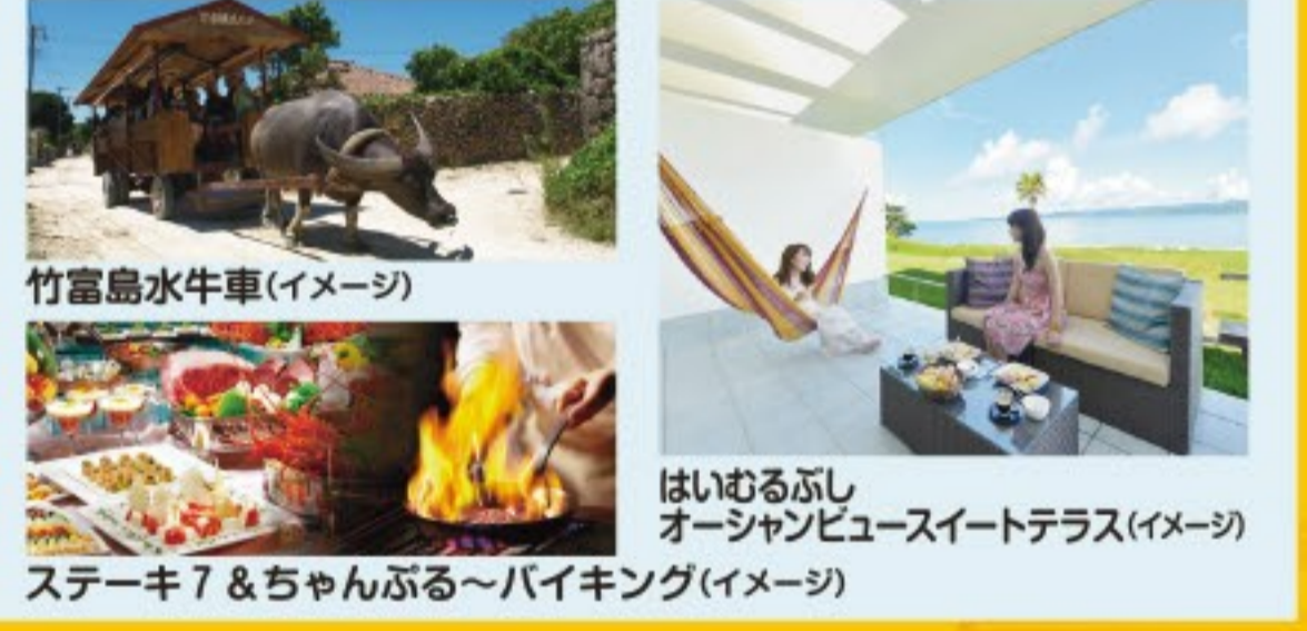
竹富島水牛車(イメージ) はいむるぶし オーシャンビュースイートテラス(イメージ) ステーキ7&ちゃんぶる～バイキング(イメージ)

お問い合わせ 感動のそばに、いつも。 観光庁長官登録旅行業第978号・日本旅行業協会正会員 株式会社 JTB北海道 オホーツク支店/北見市大通西4-4-1住友生命北見ビル4F 総合旅行業務取扱管理者/織 茂 広 TEL0157-23-2366 営業時間/9:00～18:00