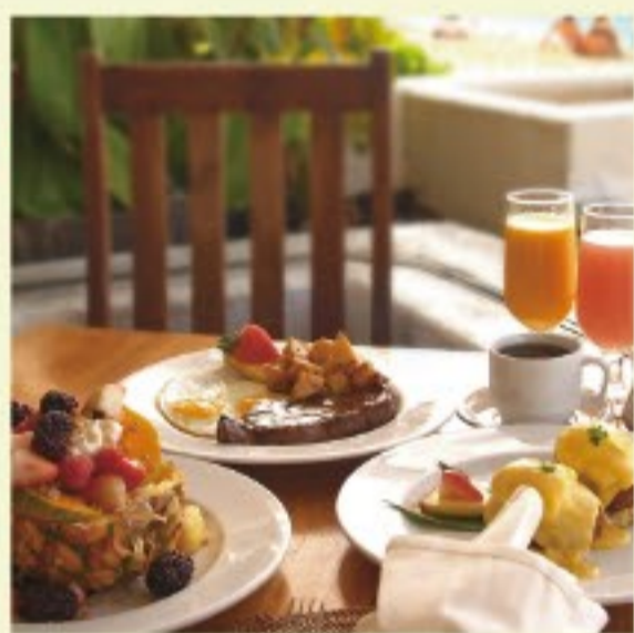
レストラン メニュー(イメージ)

「カカアコ地区」では、スコーンとマフィンを合体させた「スコフォン」が人気の複合施設ソルト(SALT)内にある「ナインパーホノルル」、ウッドシアターやウッドセンター近隣では、アパレルや雑貨等が豊富なオープンしたばかりの「Cameron Hawaii」、モダンレストラン「タンゴ・コンテンポラリー・カフェ」が人気です。