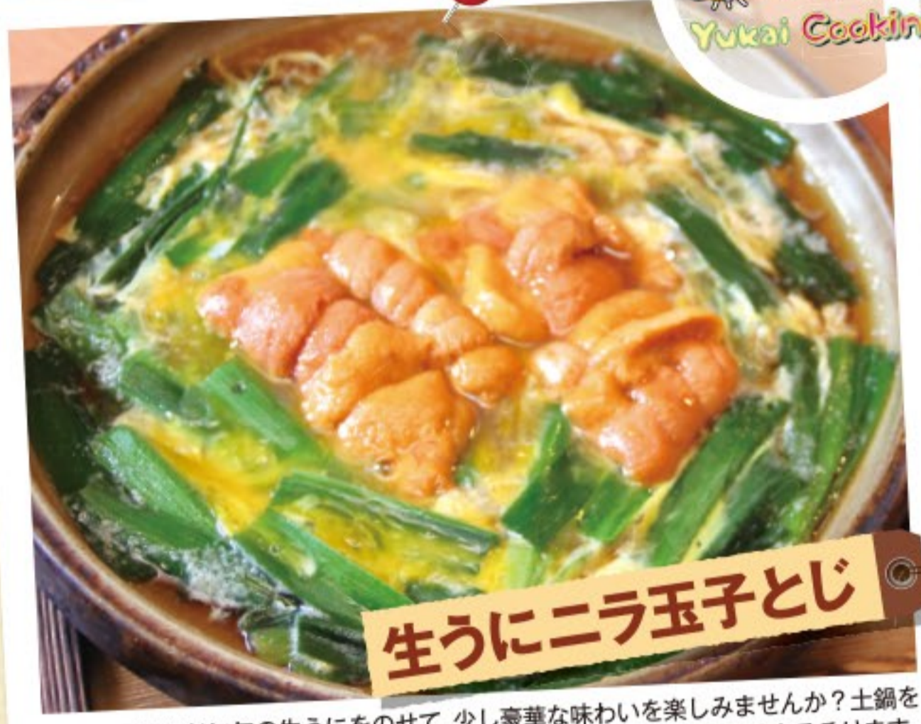
生うにニラ玉子とじ