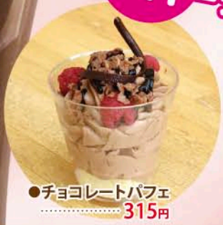
●チョコレイトパフェ 315円