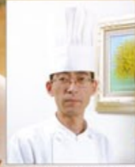
協力/菓子工房ぶーる様 北見市とん田東町617-172 TEL.0157-24-8333