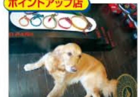
ポイントアップ店

子供連れで楽しめる新しいカタチの居酒屋 cafe KoCoRo 星はカフェ、夜は居酒屋として楽しめる。居酒屋 cafe KoCoRo は北見市山下町に昨年12月にオープンしたお洒落なメニューは星夜を通して楽しめる他、星にはバスタなどのラウンジメニューも用意しています。キッズルームを完備していますので、子供を遊ばせながら親は居酒屋メニューを味わうといった親子連れも多そうです。魚介物などの焼物は全て炭火で調理していますので、素材のおいしさが中々です。また、お洒落なインテリアも目を惹きます。お洒落なインテリアも目を惹きます。お洒落なインテリアも目を惹きます。