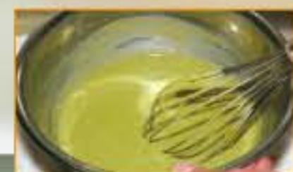
▲抹茶を牛乳でよく溶かす。