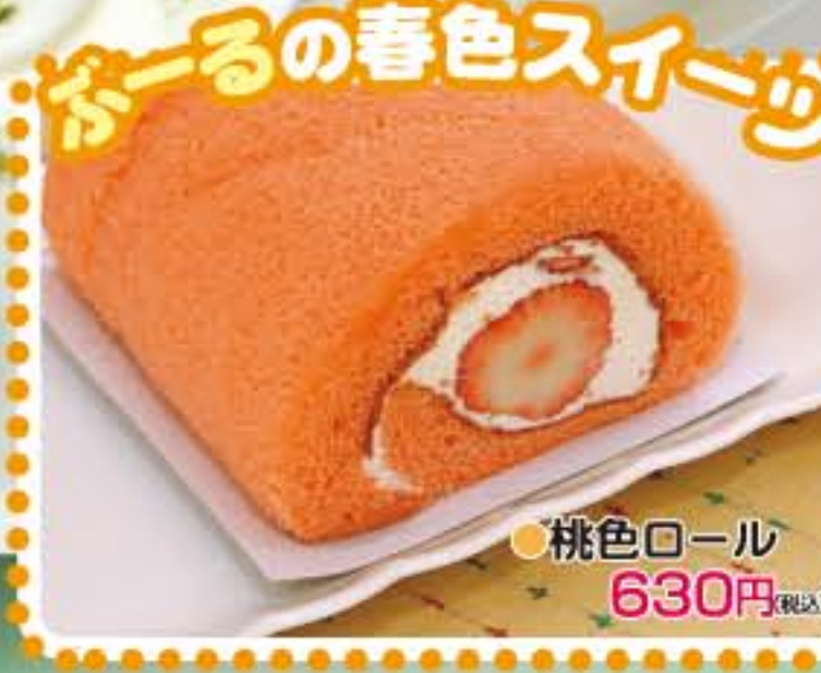
●桃色ロール 630円(税込)