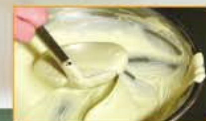
▲氷水で粗熱を取り生クリームとよく混ぜる。