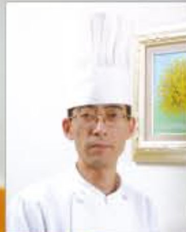
協力/菓子工房 ぶーる様 北見市とん田東町617-172 TEL.0157-24-9333